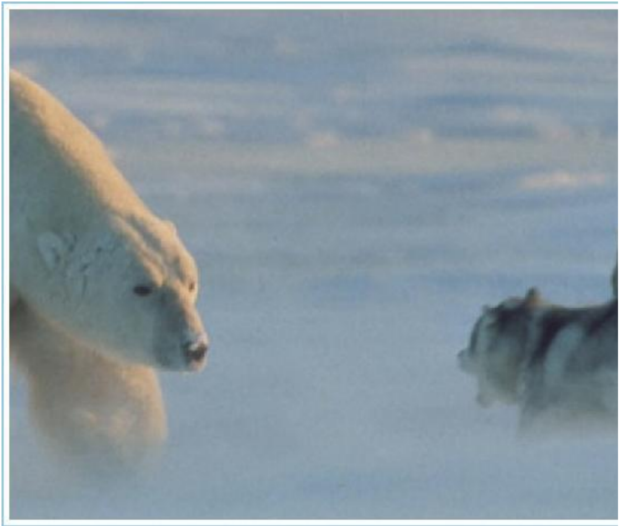
Prises par Norbert Rosing, voici les photos impressionnantes d'un ours polaire fonçant sur des chiens de traîneaux attachés dans la région sauvage de la Baie de Hudson au Canada